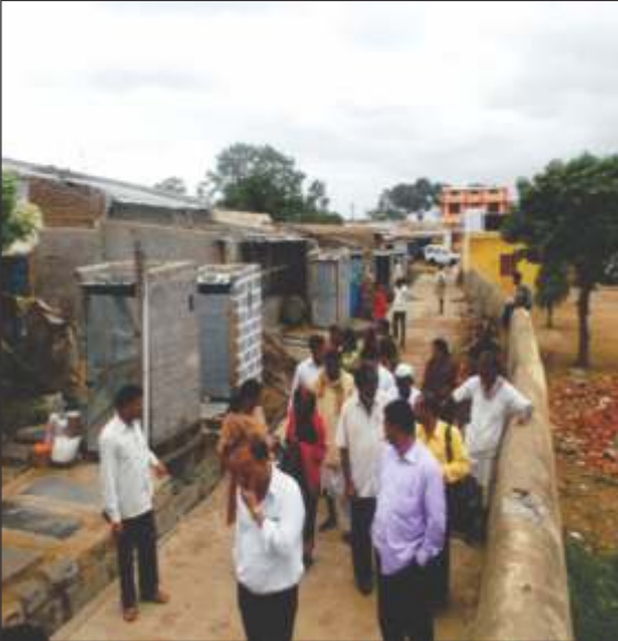
MGNREGA ಹಾಗೂ NBA ಒಗ್ಗೂಡಿಸಿ ಶೌಚಾಲಯ ನಿರ್ಮಾಣ ಗದಗ ತಾಲೂಕು ಅತೂರು ಬೆತೂರು ಗ್ರಾಮ ಪಂಚಾಯತಿ