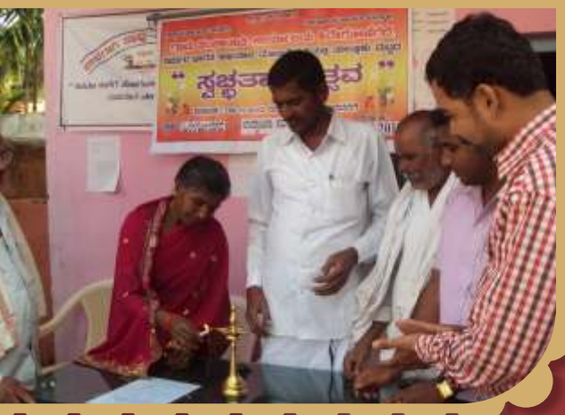
ಸ್ವಚ್ಛತಾ ಉತ್ಸವದ ಉದ್ಘಾಟನೆ