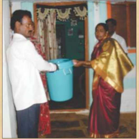
ಘನ ದ್ರವ್ಯ ತ್ಯಾಜ್ಯ ವಸ್ತುಗಳ ನಿರ್ವಹಣೆ ( SLWM ) ಗ್ರಾಮ ಪಂಚಾಯತ್ ಹುಲಕೋಟಿ, ಗದಗ ತಾಲೂಕು