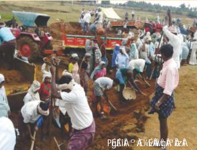
PEAiA o EA/AVGPA ZA

zAaAtUge f-e oEEAa/2 vA@EPa,CgSUmO UAaa YAZAAiAwaiAa aAa! AiAe e 1530 PAI AASUMA aA pAVZAV aA. 75./ gAaO PAI AASUMA aA/AiAeAB DZj 1af aA. 25./ gAaO