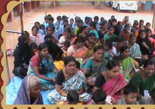
ಸ್ವಚ್ಛತಾ ಕಾರ್ಯಕ್ರಮದಲ್ಲಿ ಮಹಿಳಾ ಸ್ವಸಹಾಯ ಸಂಘದ ಸದಸ್ಯರು ಹಾಗೂ ಶಾಲಾ ಮಕ್ಕಳು