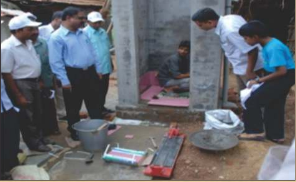
ಯೋಜನೆಗಳಡಿ ಶೌಚಾಲಯಗಳ ನಿರ್ಮಾಣ

ನಿರ್ಮಲ ಭಾರತ ಅಭಿಯಾನ ಮತ್ತು ಮಹಾತ್ಮ ಗಾಂಧಿ ರಾಷ್ಟ್ರೀಯ ಗ್ರಾಮೀಣ ಉದ್ಯೋಗ ಖಾತರಿ ಯೋಜನೆಗಳ ಒಗ್ಗೂಡಿಕೆ