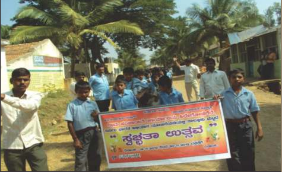
ನಿರ್ಮಲ ಭಾರತ ಅಭಿಯಾನದ ಬಗ್ಗೆ ಶಾಲಾ ಮಕ್ಕಳಿಂದ ಜಾಥಾ