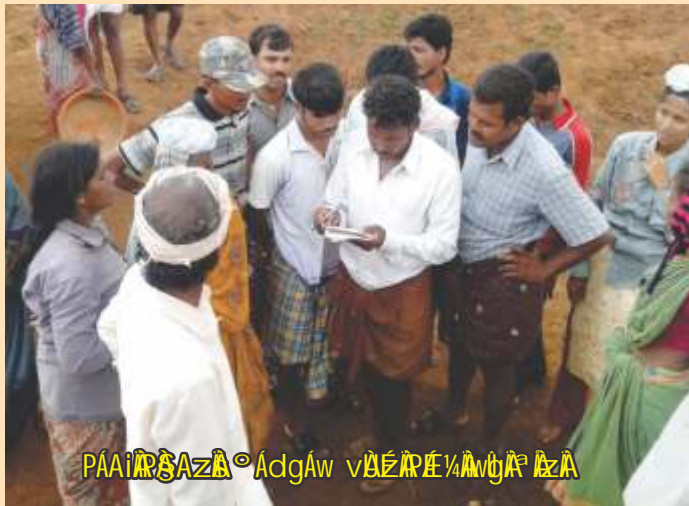
PAIARSZA AdgAw vAEPE/AVGPA ZA

CgSUmO UAaa YAZA-AwAiAa aAEgA UAaaUMAB oEEACZAV oAU-AVA PAgAS. PAAnUA GFAga SqV. aEeµPA oAUKE J.i.1.J.in. UAaa AVZAV F UAaa oAtza AvO aAVi RAqI iE«A-AZA PKEZAV aA/AiA AZA DZP e UAaaPE d«AAEUMAZA oAUKE UEaA AAVUMAZA aAgA oJ ZA SAZA gA UMAP eAgA aAVa dEj UE VEAZAgE GAmAUWZE oAUKE gA UMA SCAiA e aAgA aARgUaiAV gAUP AV oJ AiAZE EgA aZj AZA PEVZE YAA+PA aA AOT AV gEEUA gAFEUAA oAgAwAVU UAaaZAI ZMUV UAaa YAZA-AwAiAa dEgA aA AVAA UAACU GAqIAiA UAaaT GZEUA SAVj AiEAdEAIARaiA e 2012-13 EA aE PE UAaa iAIAe e DAIAAR PA AUaj AiAeAB CEAPA : 10/02/2011 gAZA PEUEArgAVAgE Zj PA AUaj AiAe e 300