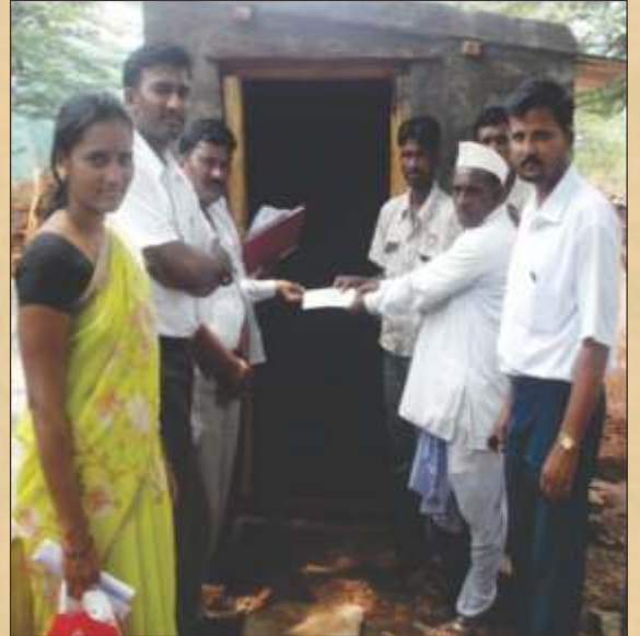
ಗದಗ ತಾಲೂಕು ನಾಗಾವಿ ಗ್ರಾಮ ಪಂಚಾಯತಿ ಶಳಾಕಾಪು ಗ್ರಾಮದಲ್ಲಿ ಪ್ರೋತ್ಸಾಹ ಧನದ ಚೆಕ್ ವಿತರಣೆ